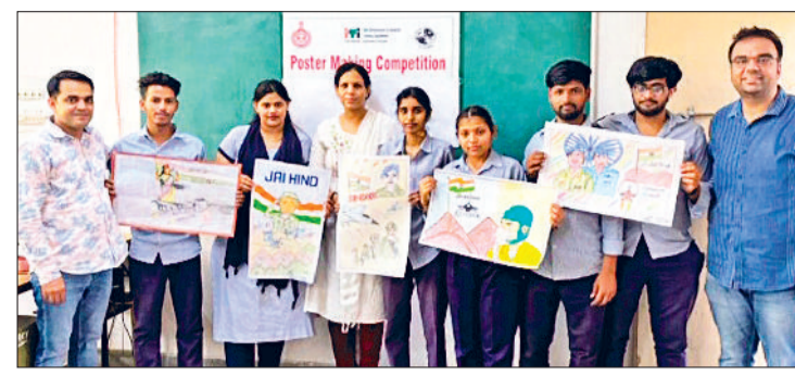
खरखोदा। अपने बनाए पोस्टर दर्शाते हुए प्रतिभागी।