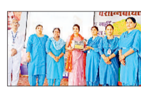
गोहाणा। अतिथियों को सम्मानित करते हुए शिक्षकगण।