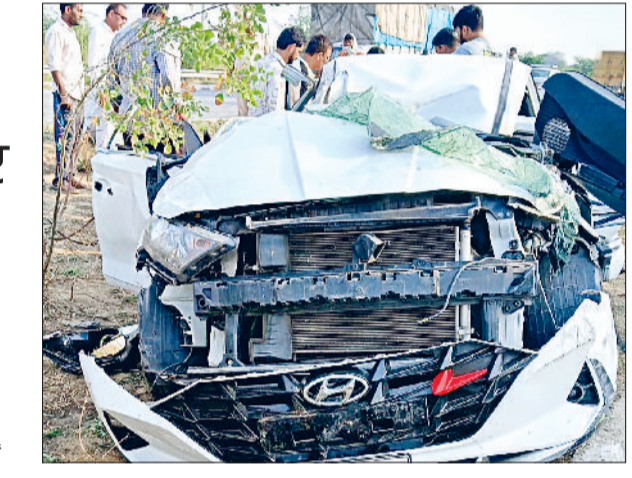
खरखौदा। हादसे के बाद क्षतिग्रस्त कार।