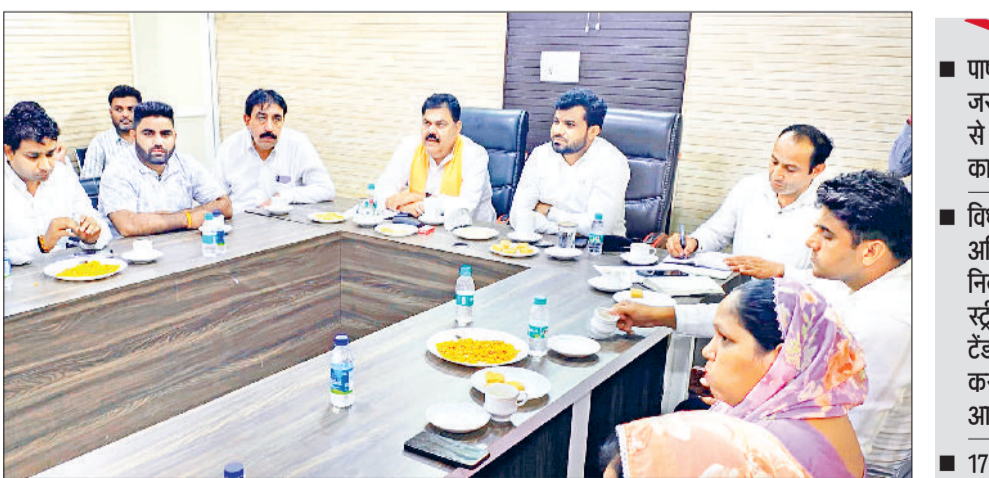
गन्वौर। नगरपालिका साधारण बैठक में उपस्थित विधायक देवेन्द्र कादियान अधिकारियों व पाषण्डों को संबोधित करते हुए।

बैठक में पाषण्डों ने स्ट्रीट लाइट और सफाई की समस्या उठाई। विधायक ने अधिकारियों को निर्देश दिए कि स्ट्रीट लाइट का टैंडर प्रक्रिया शुरू करें। विधायक ने सफाई के लिए 5 से 7 कर्मचारियों की एक टीम अतिरिक्त रखने को कहा, जिससे किसी भी वार्ड में सफाई की समस्या आने पर टीम को तुरंत भेजा जा सके। विधायक कादियान ने नया सचिव को निर्देश दिए कि किसी भी वार्ड में विकास कार्य शुरू करने से पहले संबंधित पाषण्ड को सूचित