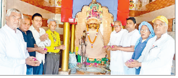
गोहाना। गुरु गोरखनाथ के चित्र पर पुष्प अर्पित करके नमन करते नागरिक।

और गुणवत्ता जांच के ही पूरे किए जा रहे हैं, जिसमें पारदर्शिता की कमी है और उन्हें पेमेंट भी कर दी जाती है। उन्होंने मांग करी है कि ज्यादा इकाइयों का प्रतिनिधित्व करने वाली एसोसिएशन की सहमती के बाद पेमेंट की जानी चाहिए। उन्होंने बताया कि कई औद्योगिक इकाइयों ने अवैध रूप से अपने अपशिष्ट को वर्षा जल निकासी सीवर में जोड़ दिया है, जिससे भूजल प्रदूषित हो रहा है। ऐसे में यह पर्यावरण और स्वास्थ्य के लिए खतरा है। ऐसे इकाइयों पर कार्रवाई होनी चाहिए। सीईटीपी प्लांट की कार्यप्रणाली भी सही नहीं है। इसमें आवश्यक रसायनों का सही तरीके से उपयोग नहीं हो रहा है और रिकार्ड अधूरे हैं। इसकी जांच कर जानी चाहिए।